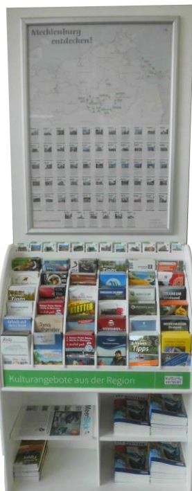
Beispielabbildung - vor Ort in verschiedenen Varianten